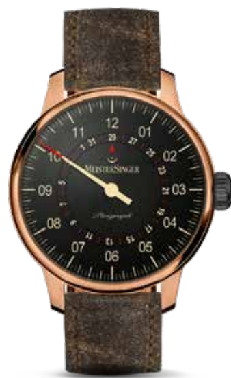
Perigraph Bronze 2018 Edition € 2.090,-