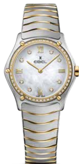
Sport Classic € 4.600,-

Man en vrouw hebben veel gevoel voor het horloge-vak en de naam Ebel wordt al snel bekend als producent van bijzondere, decoratieve sieraadhorloges. Het gevoel voor esthetiek dat Ebel al 117 jaar etaleert is verbluffend origineel en beklijvend. In de nieuwe Discovery-collectie bijvoorbeeld worden de kenmerkende, vloeiende Ebel-lijnen aangewend om tot een sportief en zelfs robuust horloge te komen dat zijn elegante afkomst evenwel niet verloochend.