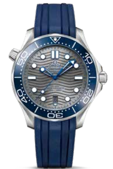
Seamaster Diver 300m € 4.400,-