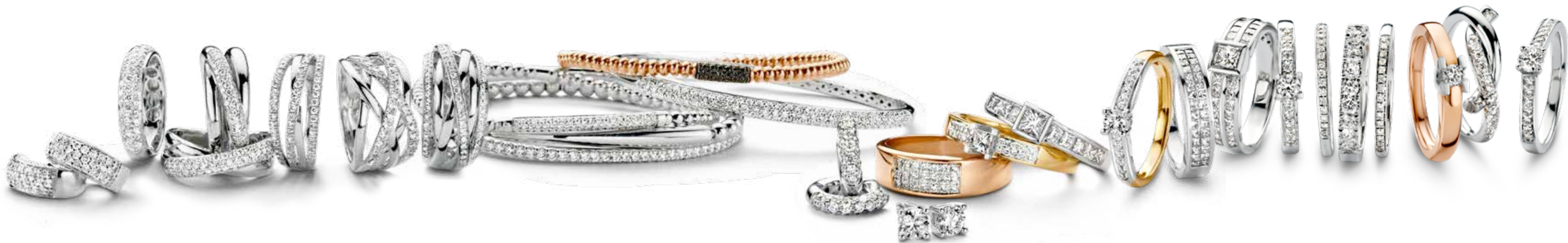
Creolen €2.975,- Ringen €3.350,- €1.575,- €1.650,- €1.925,- €1.750,- €2.375,- Armbanden van onder naar boven €3.250,- €990,- €2.250,- €4.495,- €1.325,-

De diamant representeert onoverwinnelijkheid en is een symbool van eeuwige, ongeschonden puurheid. Oneindige ringen in verschillende uitvoeringen verbeelden een bijzondere verbintenis op onnavolgbare wijze. De solitair oorstekers in witgoud zijn druppels van licht.