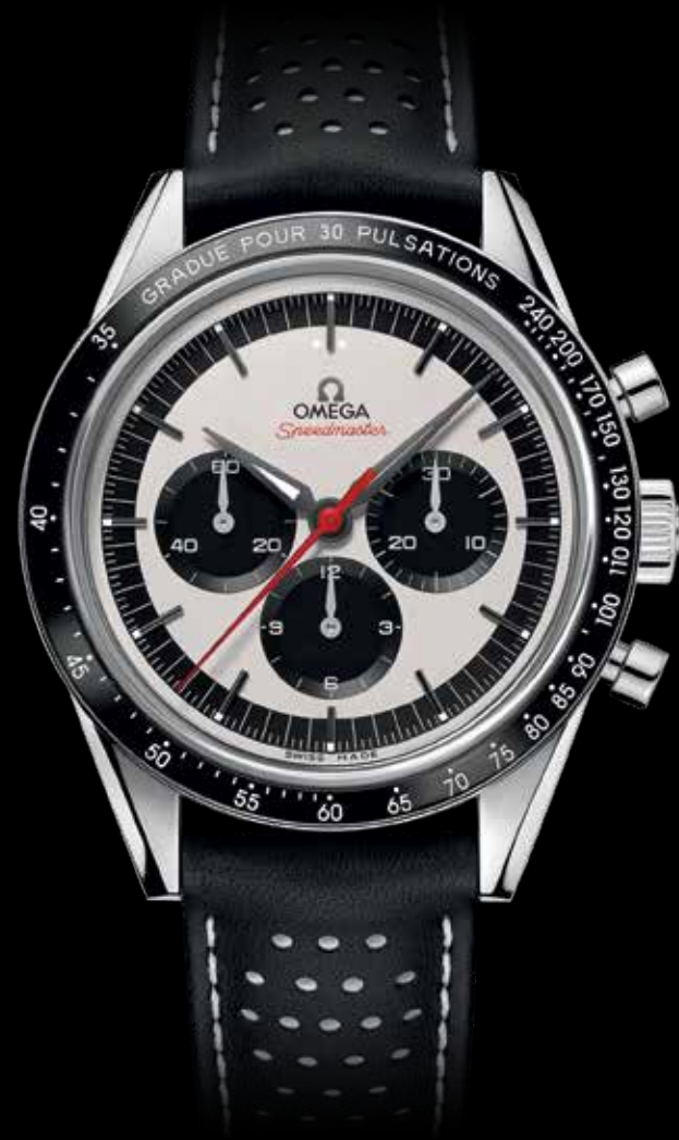
Omega Speedmaster CK2998 Pulsometer € 5.400,-