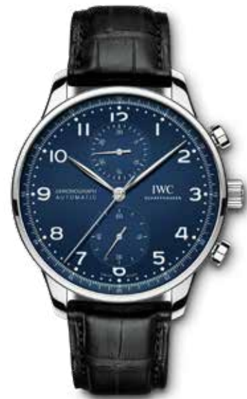
Portugieser Chronograph € 7.700,-

Portugieser Chronograph in 40,9 mm stalen kast waarin een automatisch chronograafuurwerk tikt. De twee subdials op 12 en 6 uur bepalen het aanzicht van deze klassieker met sportieve aspiraties