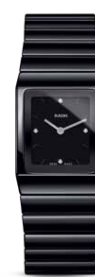
Ceramica Jubilé € 2.010,-

True Automatic Open Heart in ongenaakbaar glanzend en uiterst krasbestendig Plasma hightech keramiek.