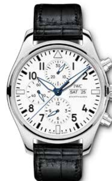
Portofino Chronograph "150 years" € 5.800,-

Portofino Automatic Edition "150 Years" is een klassieker van vandaag en morgen. Het tot 2.000 stuks gelimiteerde horloge heeft een gelakte witte wijzerplaat met elegante Romeinse cijfers en de stalen kast meet 40 mm