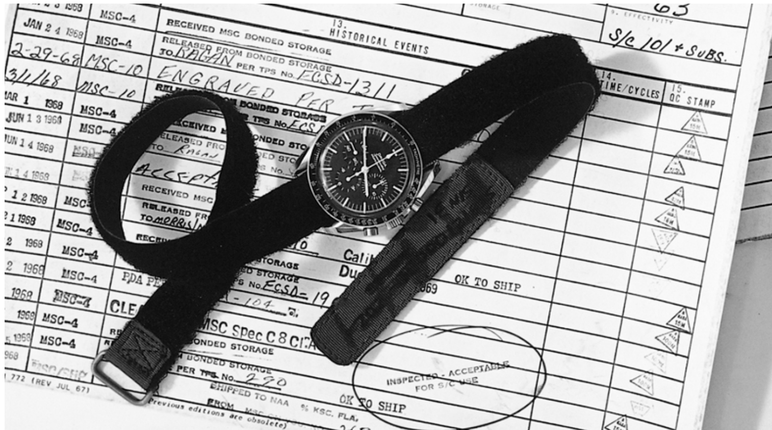
De eerste Omega Speedmaster op de maan voordat deze spoorloos verdween.

Laat een man een drietal horloges zien. Een duikhorloge, een klassiek model en een chronograaf. Vraag hem vervolgens het favoriete horloge aan te wijzen. In bijna alle gevallen zal de chronograaf de winnaar zijn. Geen complicatie is namelijk zo populair als de chronograaf. Bij Saffier weten we er alles van. Van mechanische manufactuur-chronos tot hightech modellen met een quartz-uurwerk.