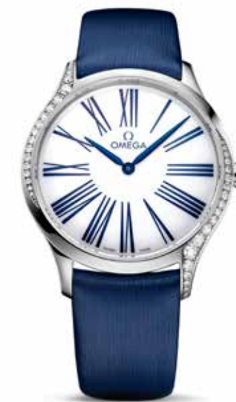
De Ville Trésor Quartz 36mm € 4.600,-