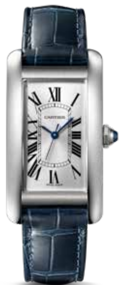
Tank Américaine € 5.000,-