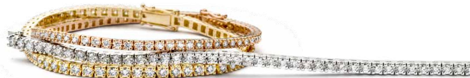
Oorstekers €1.995,- Ring €2.250,- Hanger €1.795,- Armband rosé goud €6.450,- Armbanden wit en geel goud €8.450,-