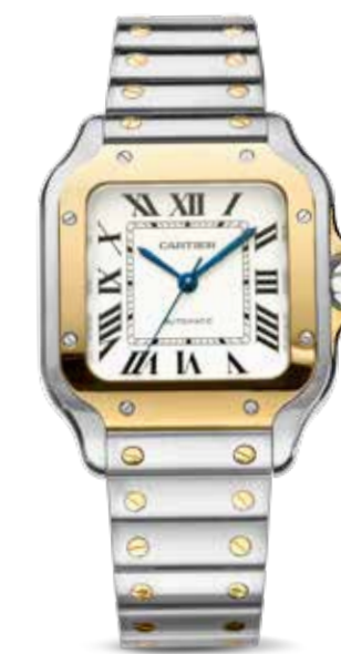
Santos € 8.850,-