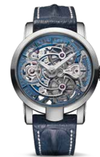
Skeleton Pure Water Limited Edition € 33.750,-