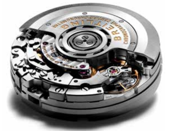
Het in eigen huis door Breitling ontwikkelde Bo4 chronograafuurwerk

Wie wel een chronograaf wil dragen, maar niet per se mechanisch, heeft de keus aan een groot aantal quartz-chronografen. De prijs van een batterij-aangedreven chronograaf is beduidend lager dan een mechanische variant en het aanbod is groot. Bij Saffier Juweliers hebben we in onze collectie onder andere de sportieve 'Swiss Made' chronografen van Tissot uitgerust met een zeer accuraat en betrouwbaar quartz-uurwerk. Wat alle chronografen met elkaar gemeen hebben zijn de extra wijzers, de extra poussoirs, de extra actie en de extra uitstraling.