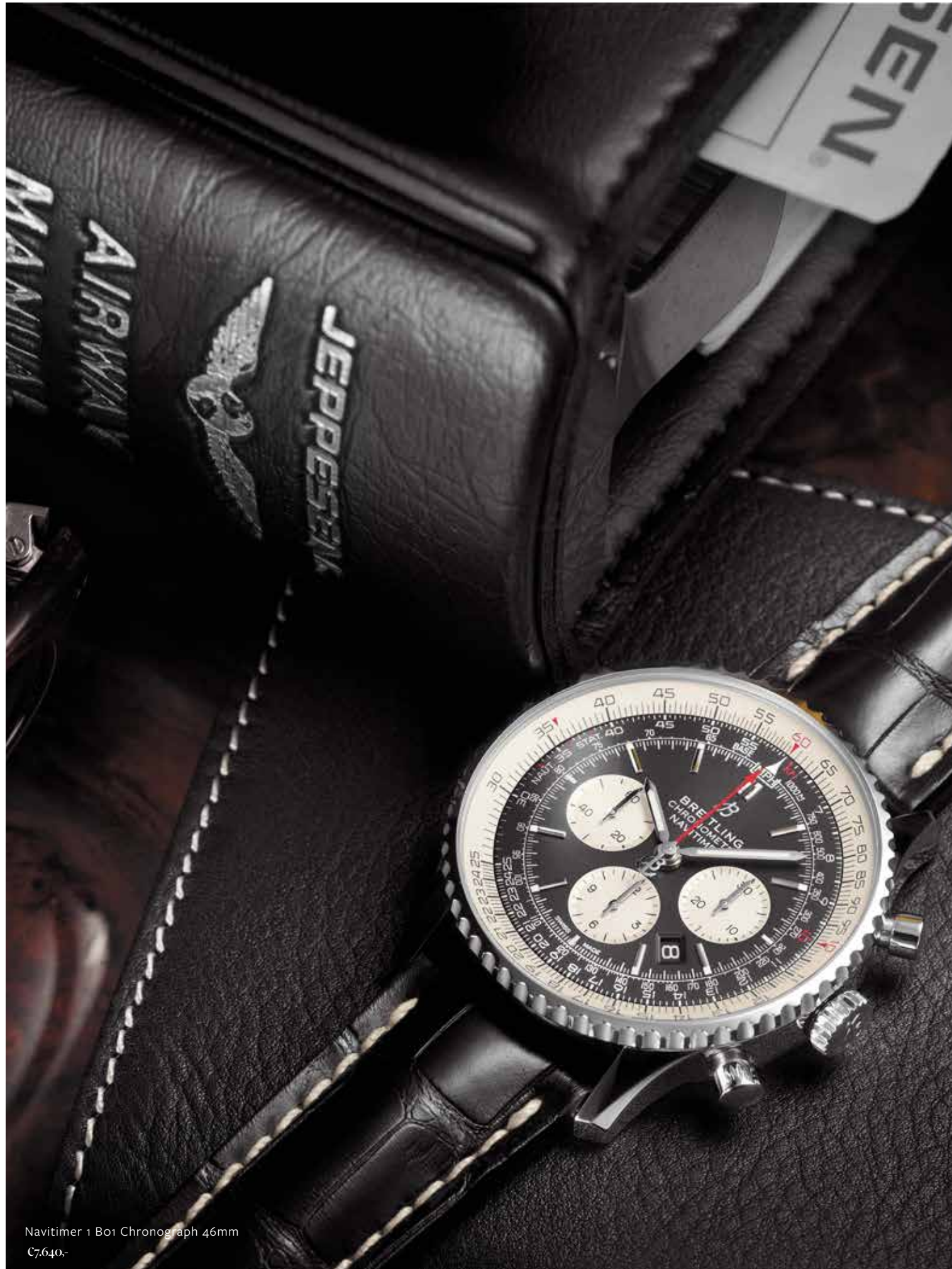
Navitimer 1 B01 Chronograph 46mm €7.640,-