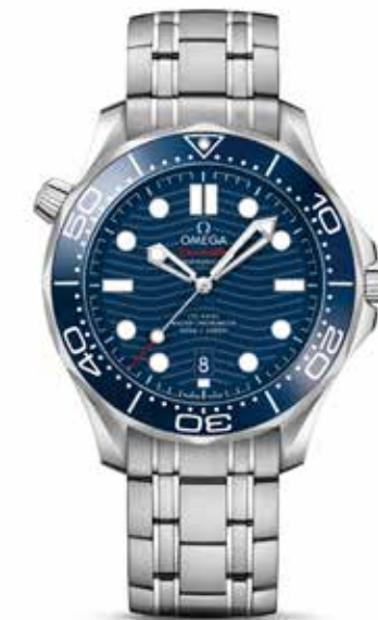
Seamaster Diver 300m € 4.500,-