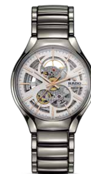
True Automatic Open Heart € 2.150,-

True Automatic Diamonds in lichtgewicht en hoogwaardig keramiek voor optimaal draagcomfort.