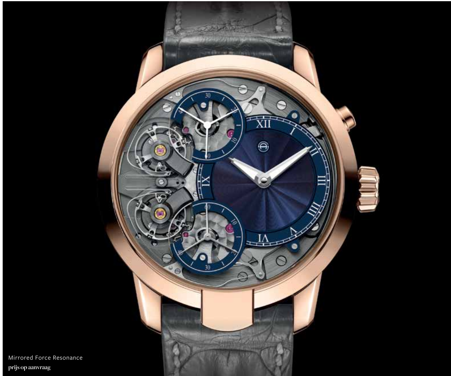
Mirrored Force Resonance prijs op aanvraag