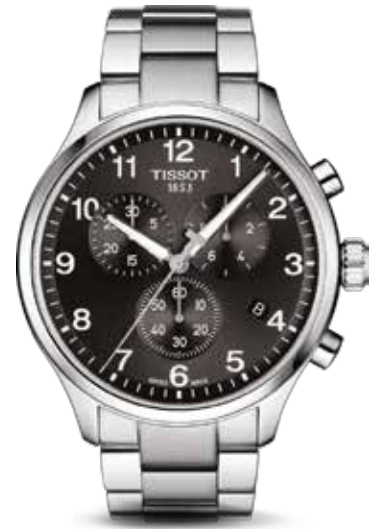
Chrono XML €360,-