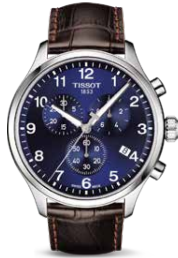
Quartz Chrono XL €330,-