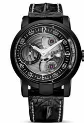
Gravity Edge € 15.400,-