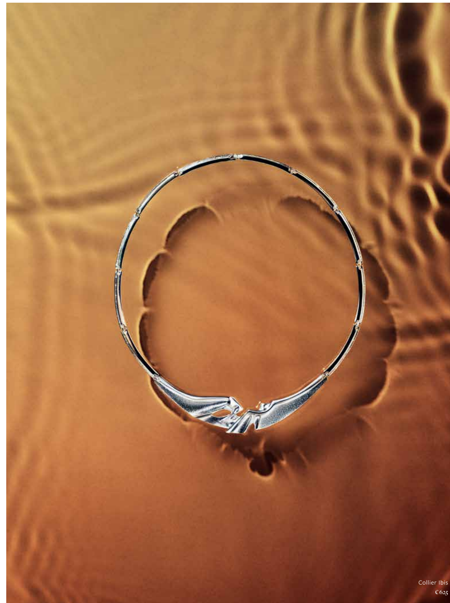
Collier Ibis € 625