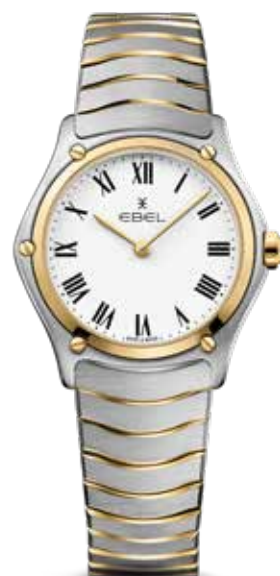
Sport Classic € 2.600,-