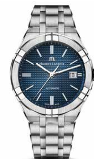
Aikon Automatic € 1.690,-

Pontos Day Date in een moderne combinatie van antracietgrijs en roségoud.