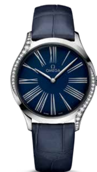
De Ville Trésor Quartz 36mm € 4.100,-

De Ville Trésor Quartz 36 mm met een slanke stalen kast en diamanten langs beide zijden. De gepolijste kroon is ook getooid met een fonkelende diamant.