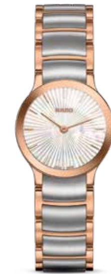
Centrix € 870,-

Centrix in een zeer delicate 23 mm kast die echter heel ongenaakbaar is.