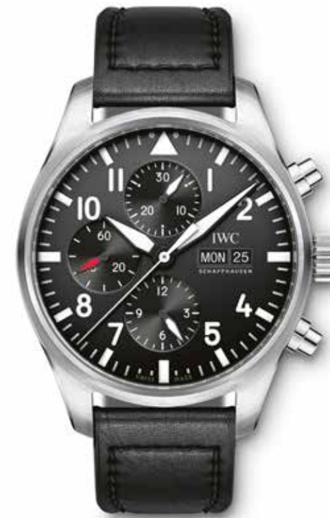
De klassieke IWC Pilot's Watch Chronograph is een no-nonsense precisie-instrument.

Door de grote diversiteit en het grote aanbod aan chronografen wordt vaak vergeten dat een mechanisch chronograafuurwerk een zeer delicaat en gecompliceerd samenspel is van raderen, hefbomen en in elkaar grijpende tanden. Het ontwikkelen van een chronograafuurwerk is dan ook een tijdrovend karwei en dat verklaart de hogere prijs voor een manufactuuruurwerk van