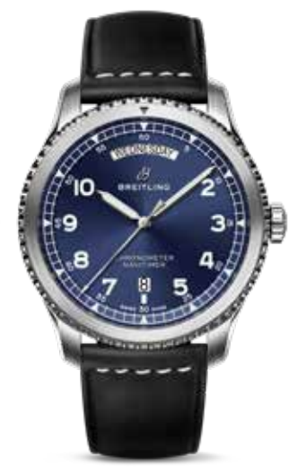
Navitimer 8 Aut. Day-Date 41 € 3.750,-