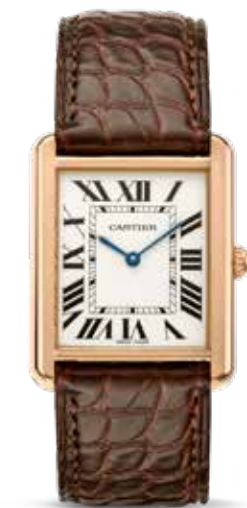
Tank Solo € 4.450,-