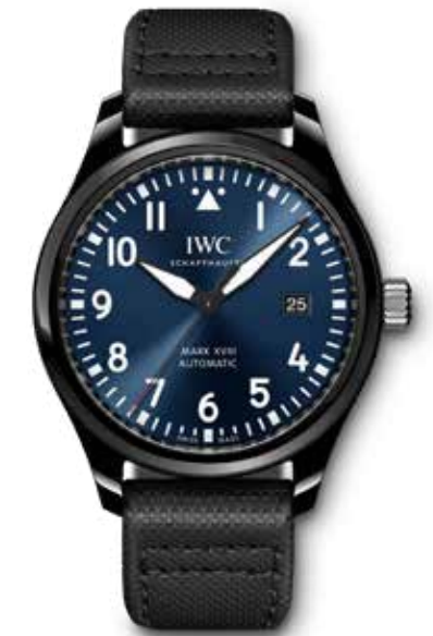
Pilot's Watch Mark XVIII Edition "Laureus Sport for Good Foundation" € 6.300,-

De passie voor innovatie is altijd een belangrijk element geweest bij IWC.