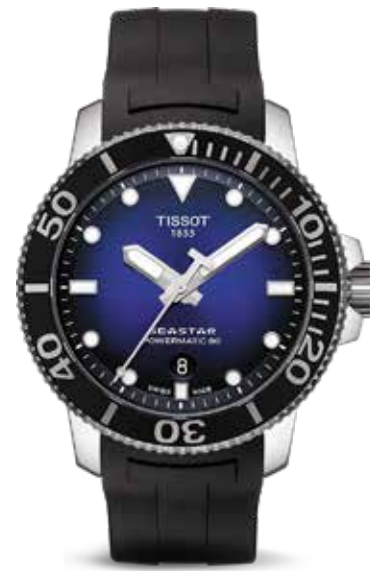
Seastar Blue €695,-

De Tissot Seastar 1000 Automatic is verkrijgbaar in vier versies. In de stalen 43 mm kast tikt een Powermatic-80 kaliber met een gangreserve van 80 uur. Dat uurwerk blijft verstoken van zoet- of zoutwater tot een diepte van 300 meter. De keramische lunette is slechts in één richting te verdraaien (tegen de klok in) voor de veiligheid van de duiker.