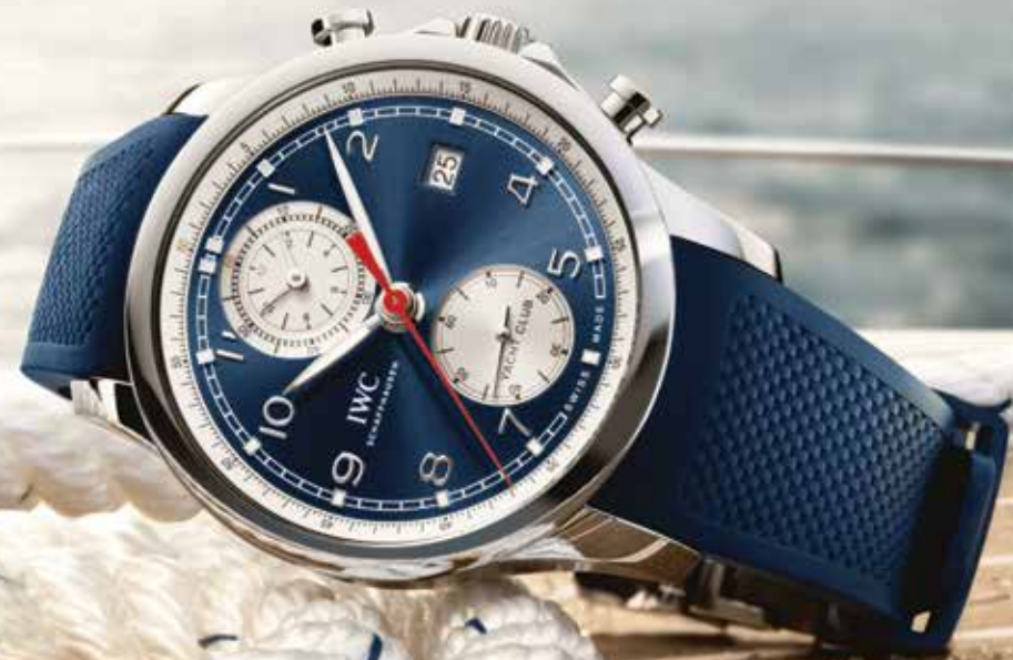
Portugieser Yachtclub C 12.300,-

Portugieser Yachtclub Chronograph in stalen, fraai afgeronde 43,5 mm kast met subtiele kroonbescherming.