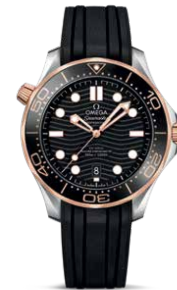
Seamaster Diver 300m € 6.100,-