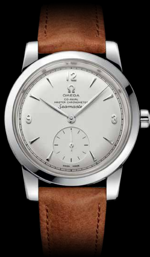
Seamaster 1948 Limited Edition € 6.300,-