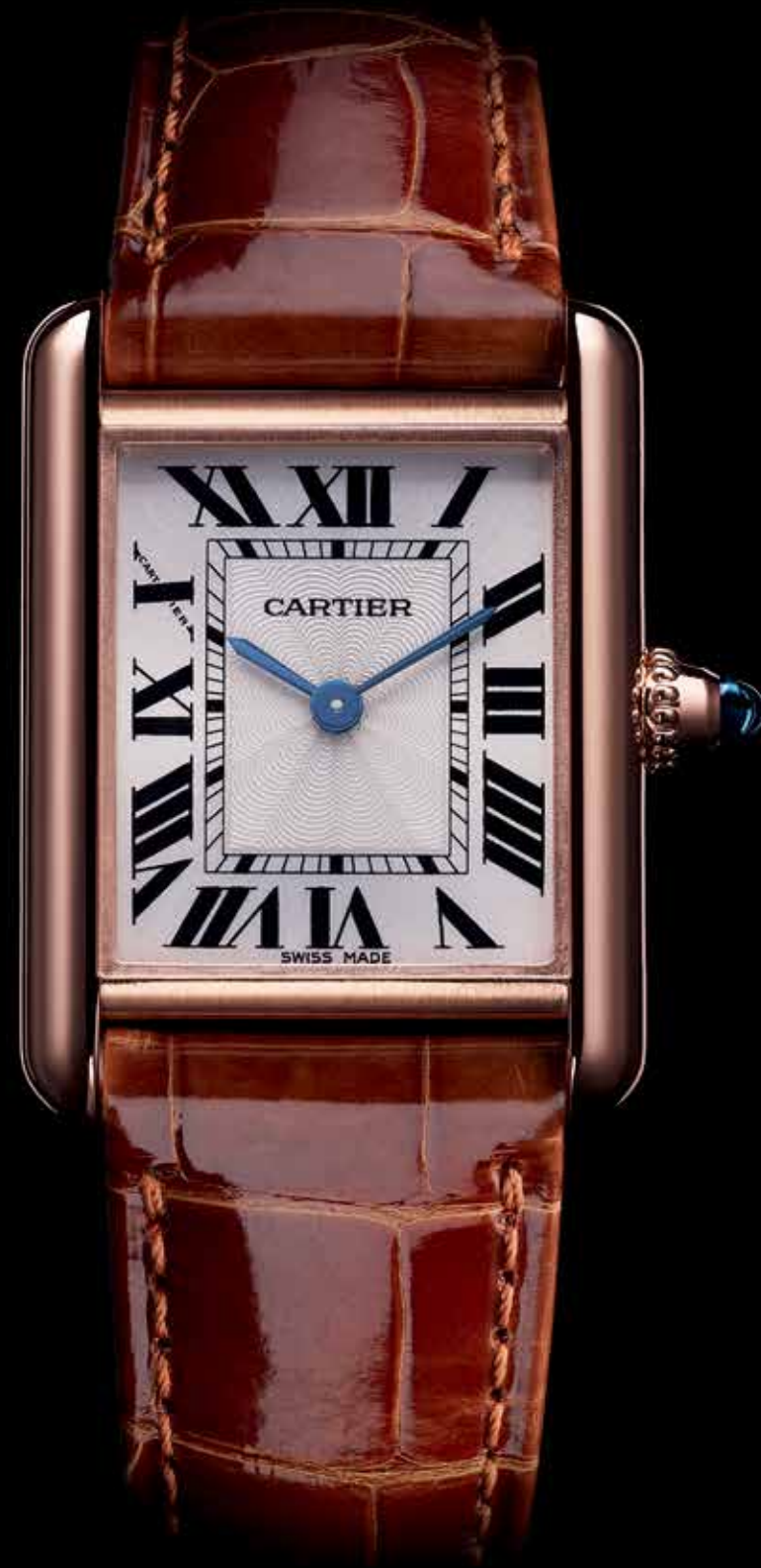
Tank Louis Cartier € 9.600,-