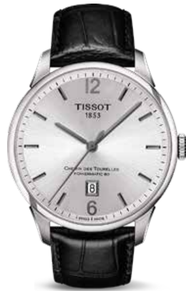
Chemin de tour 80 uur €760,-