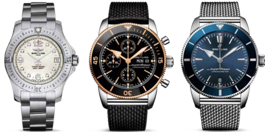
Colt 36 € 3.550,-

Functionele en professionele tijdsinstrumenten met flair.