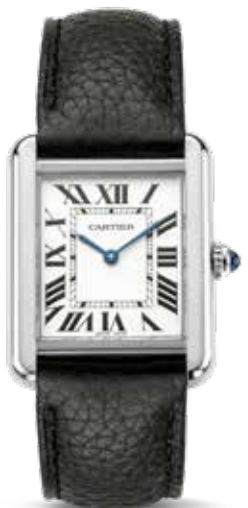
Tank Solo € 2.330,-