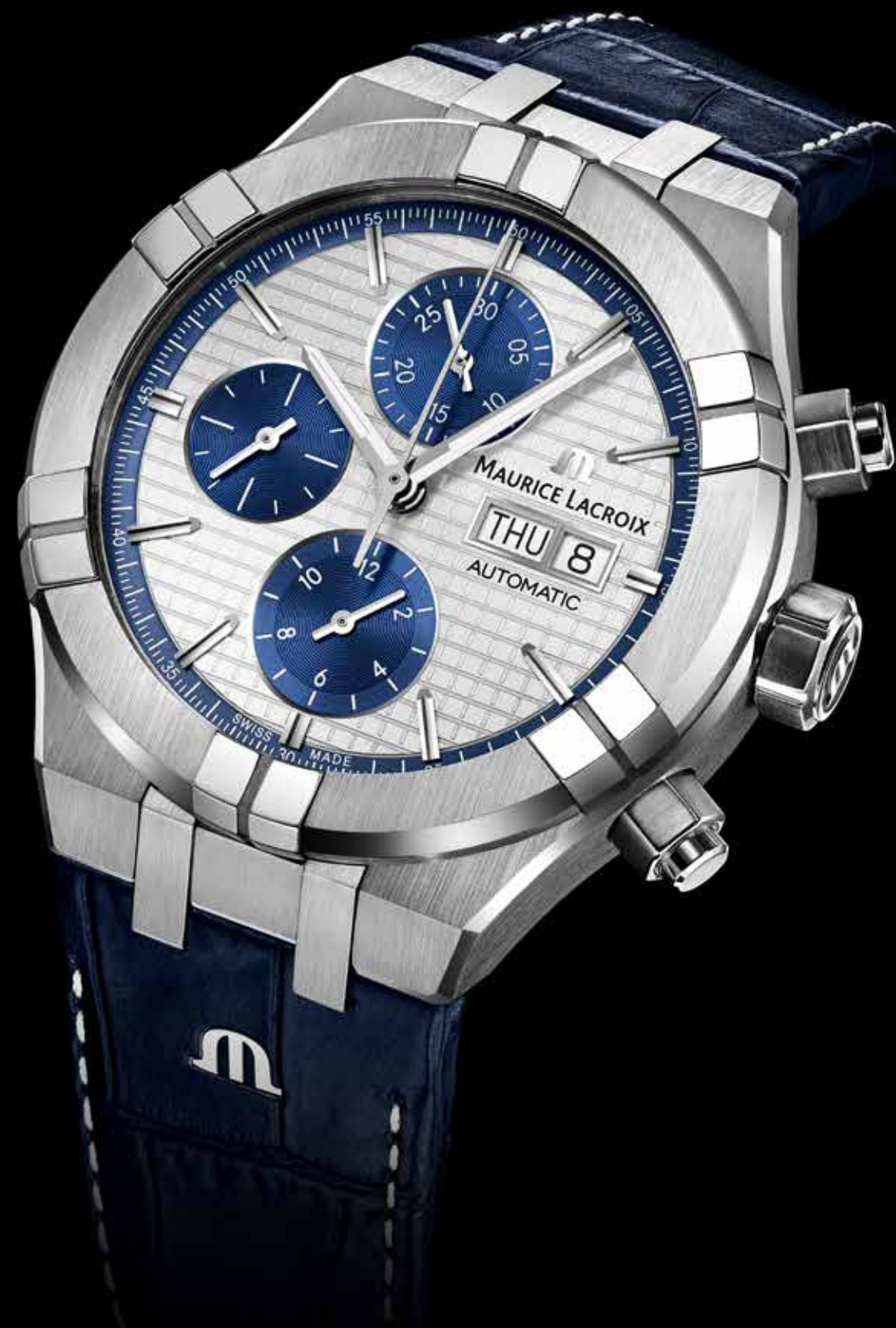
Aikon Chronograph Automatic € 2.690,-

Aikon Chronograph Automatic uitgevoerd in gesatineerd staal met gepolijste accenten. De Aikon is een toonbeeld van kracht en karakter door de uitgesproken vormen, het klassieke Clous de Paris-patroon op de wijzerplaat en het automatische chronograafuurwerk in de 44 mm kast.