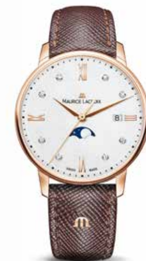
Eliros Moonphase 35 € 945,-

Eliros Moonphase 35 in geheel stalen uitvoering met een wijzerplaat van parelmoer en diamanten indexen.