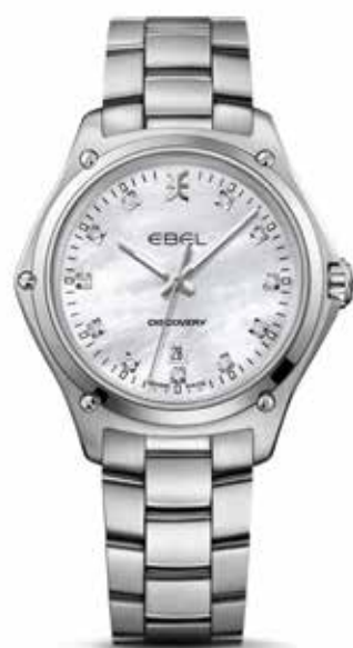
Discovery € 1.950,-