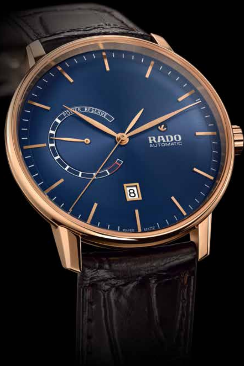
Coupole Classic XL € 1.690,-

De Coupole Classic met gangreserve-aanduiding heeft het tijdloze voorkomen van een traditioneel polshorloge. De combinatie van een stralend blauwe wijzerplaat met een 41 mm kast van staal voorzien van een beschermende roségouden PVD-coating, is onontkoombaar en charismatisch.