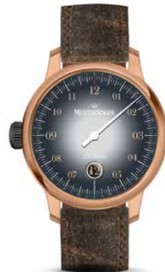
NL Edition 2018 Limited € 1.990,-