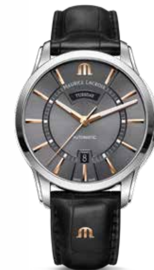
Pontos Day Date € 1.590,-

Eliros Moonphase 35 in roségoud gekleurd staal en diamanten indexen. Een klassiek horlogecompositie met een vrouwelijke twist.