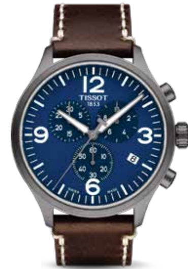
Chrono XL €330,-

Tissot verbindt een sterke horlogetraditie met een gevoel voor hedendaagse stijl.