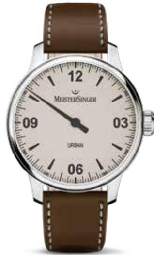
Urban € 795,-