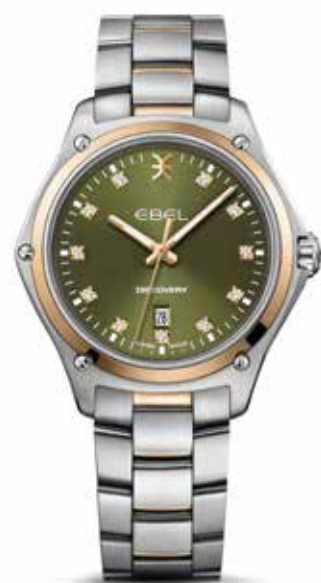
Discovery € 2.500,-

Het is moeilijk één specifiek hoogtepunt in de geschiedenis van Ebel aan te wijzen, het horlogehuis heeft namelijk een flink aantal horloges op het conto die zeer eigenzinnig zijn. Met de Sport Classic uit 1977 introduceerde Ebel een golvende vormgeving die zowel feminien als masculien is. De organisch vloeiende lijnen zijn niet het exclusieve domein van één sekse; zowel dames als heren kunnen zich identificeren met het natuurlijke ontwerp en daardoor is de Sport Classic een onvergetelijke klassieker geworden. Ebel maakt al 117 jaar 'golven' in de horlogewereld. In 1911 richtte het echtpaar Eugène Blum en Alice Lévy het horlogehuis op. De gekozen merknaam, die wordt geregistreerd in het Zwitserse La Chaux-de-Fonds, wordt gevormd door de beginletters van Eugène Blum Et Lévy, oftewel 'EBEL'.