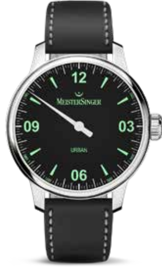
Urban € 795,-