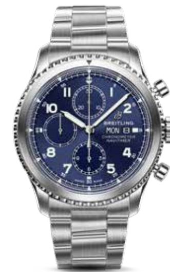
Navitimer 8 Chrono 43 € 6.120,-

Het hoogtepunt in de nieuwe Navitimer 8-collectie is de Navitimer 8 B01 Chronograph 43 mm met afwisselend gesatineerde en gepolijste oppervlakken. Het datumvenster op 4:30 uur geeft aan dat gebruik wordt gemaakt van het eigen, automatische en COSC-gecertificeerde B01 chronograafuurwerk. Tweede in lijn is de Navitimer 8 Chronograph 43 mm. Het horloge is geheel gesatineerd, heeft een wijzerplaat met subdials in dezelfde kleur en een functionele dag/datum-aanduiding op 3 uur. Het automatische chronograafuurwerk is niet in het eigen atelier gebouwd, maar wel chronometer-precies. De Navitimer 8 Automatic Day-Date met dag-venster op 12 uur en de datum op 6 uur, is een 41 mm-horloge voorzien van een automatisch uurwerk op ETA-basis dat de naam Calibre 45 heeft gekregen. Opvallend mannelijk is de Navitimer 8 Automatic 41 in karakteristieke en krachtige Black Steel-uitvoering. In de kast tikt het automatische chronometeruurwerk Calibre 17 dat is gebaseerd op het ETA-kaliber 2824-2.