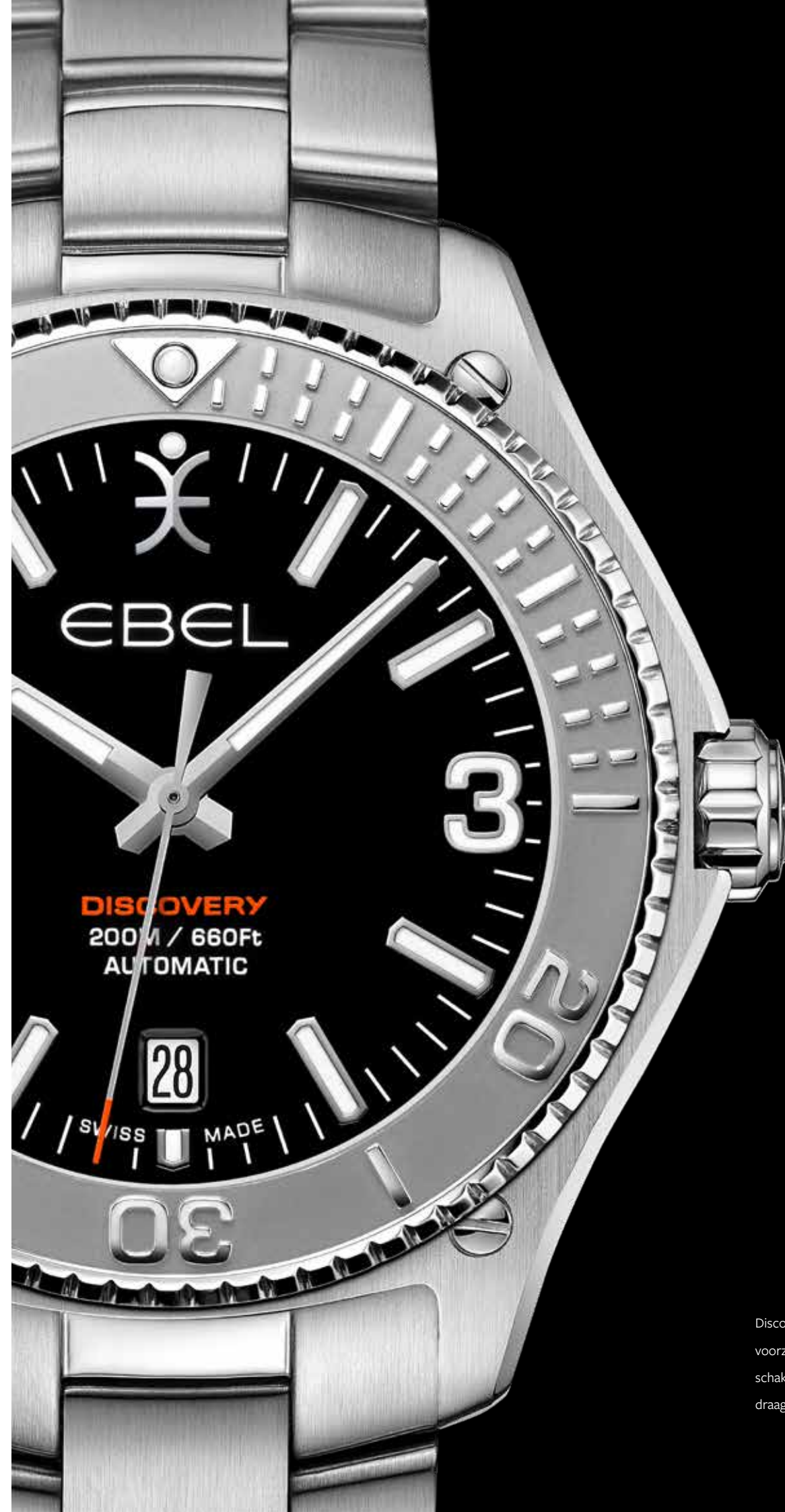
Discovery Diver € 1.850,-

Discovery Diver in stalen, gesatineerde kast met duikring voorzien van aanduidingen in reliëf. De fraai afgewerkte stalen schakelband is voorzien van een vouwsluiting voor optimaal draagcomfort. In de tot 200 meter waterdichte 41 mm kast tikt een Zwitsers uurwerk met automatische opwinding