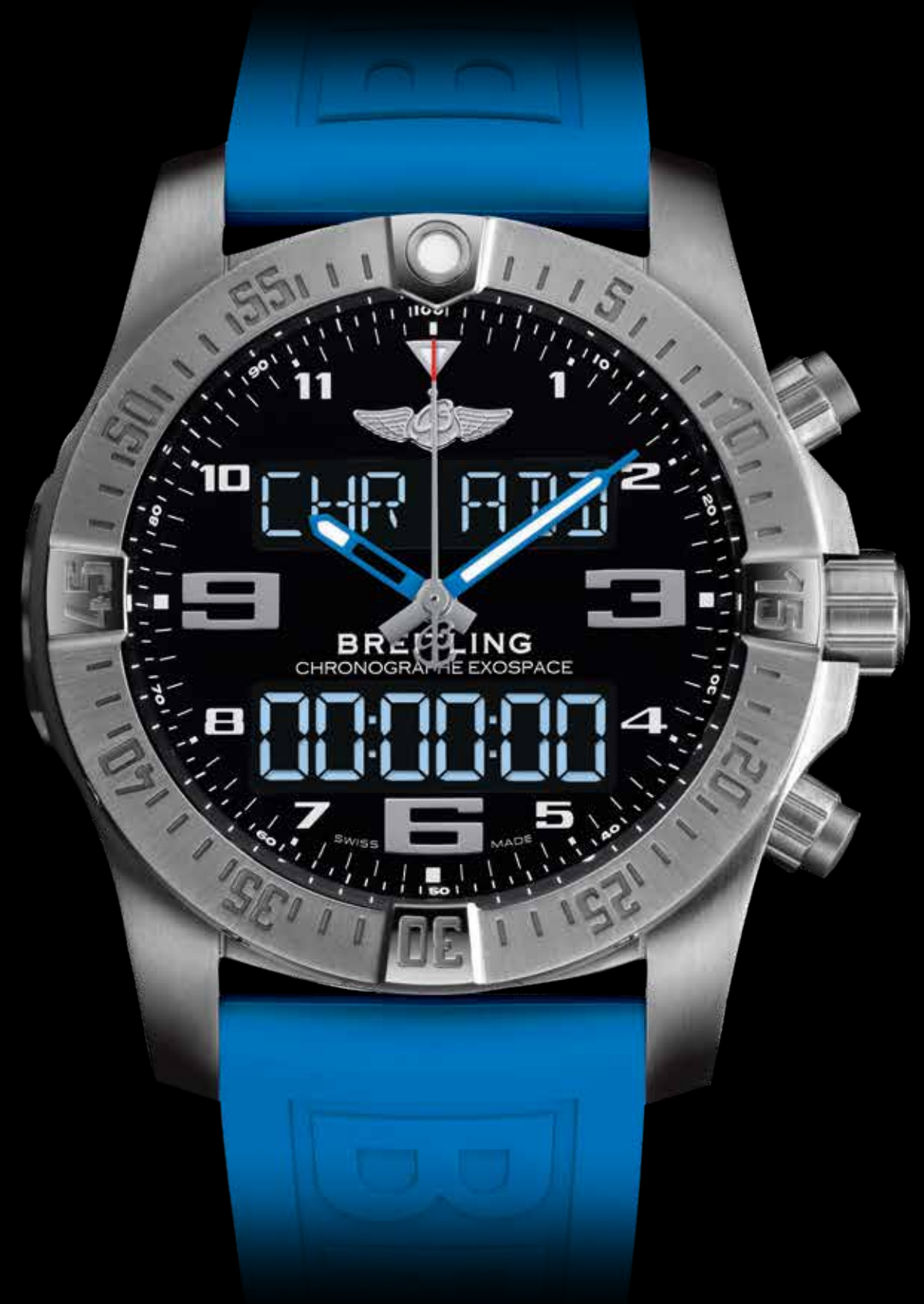
Exospace B55 Black Titanium € 8.050,-

De Superocean Heritage II is gebaseerd op het origineel uit 1957.