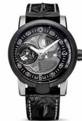
Racing Limited Edition € 13.900,-