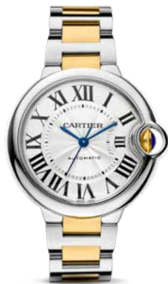
Ballon Blue 36mm € 8.450,-

Behalve rechthoekig en vierkant heeft Cartier nog meer vormen in de vingers. Ovaal bijvoorbeeld zoals te zien is in de auto-geïnspireerde Cartier Roadster die verschijnt in een 36 mm damesmaat en een XL 43 mm kast voor heren. Cartier zou Cartier niet zijn als het zelfs de ronde vorm niet naar eigen hand zou kunnen zetten. Rond is de meest voorkomende horlogevorm, maar bij Cartier is rond nooit gewoon rond. In 1985 presenteert Cartier de ronde Pasha met zijn opvallend prominente kroonontwerp en een puntige blauwe cabochon. Cartiers meest opvallende ronde creatie is waarschijnlijk een toekomstige klassieker, de Ballon Blue. Dit ronde horloge met een kroon die zich bevindt binnen het silhouet van de kast, verschijnt in 2007 in verschillende maten en in verschillende materialen voor mannen en vrouwen. De Ballon Bleu voor mannen en vrouwen is rond en glad als een kiezelsteen en door de Romeinse cijfers heeft het horloge de archetypische Cartier-look.