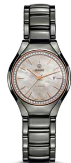
True Automatic Diamonds € 2.660,-

Design en onaantastbaar keramiek vormen samen zowel de hoeksteen als het DNA van Rado.