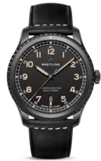
Navitimer 8 Date 41 € 3.900,-