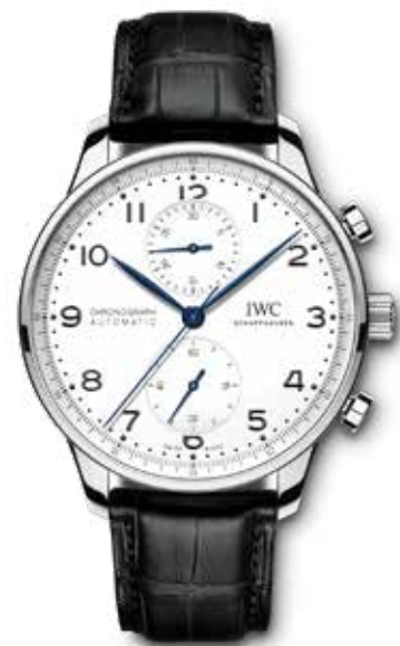
Portugieser Chronograph "150 years" € 8.000,-

Portugieser Chronograph in 40,9 mm stalen kast waarin een automatisch chronograafuurwerk tikt. De twee subdials op 12 en 6 uur bepalen het aanzicht van deze klassieker met sportieve aspiraties