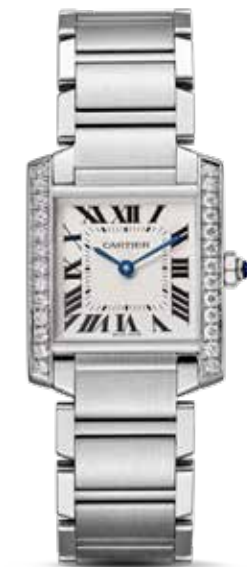
Tank Française € 7.900,-

“Als alle tanks door Cartier waren gemaakt, zouden we in vrede leven” - Jean-Charles de Castelbajac