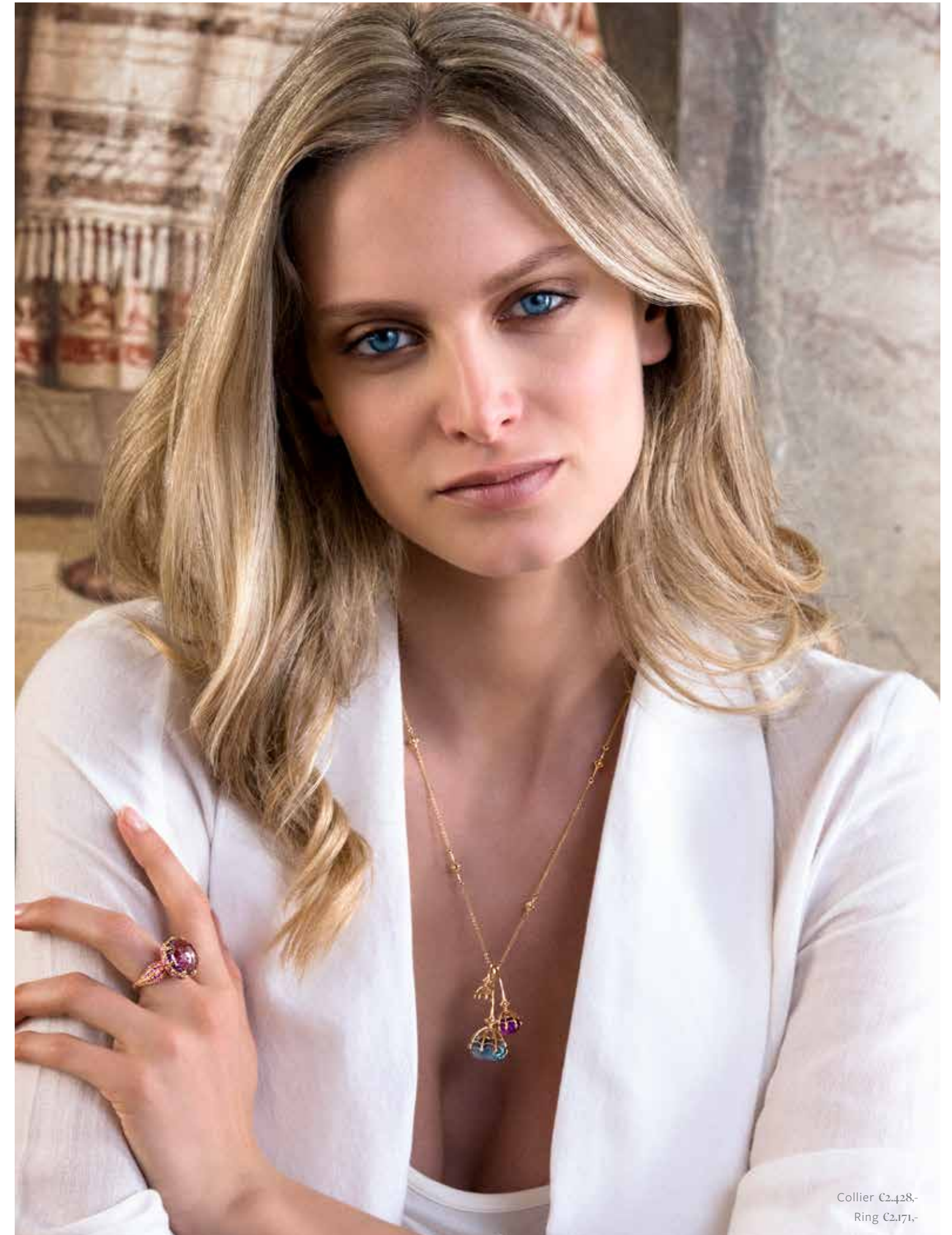
Collier €2.428,- Ring €2.171,-