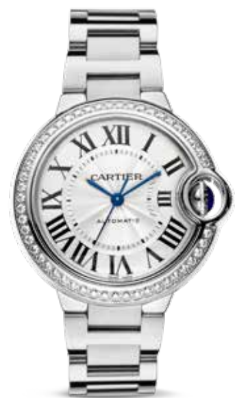
Ballon Blue 36mm € 10.500,-