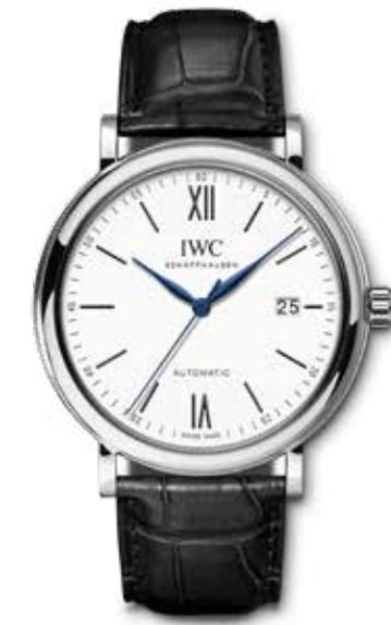
Portofino Automatic "150 years" € 4.700,-

Portofino Chronograaf met zeer klassiek gevormde poussoirs die de chronograaffuncties bedienen. De 42 mm stalen kast is groot genoeg om een indruk achter te laten en ingetogen genoeg om tijdloos te zijn.