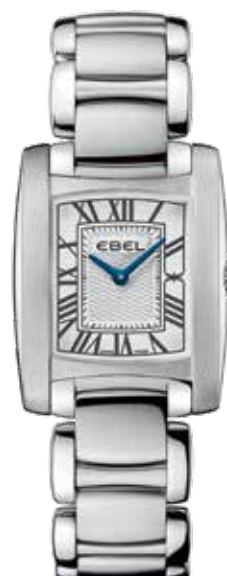
Brasilia Mini € 2.300,-

Man en vrouw hebben veel gevoel voor het horloge-vak en de naam Ebel wordt al snel bekend als producent van bijzondere, decoratieve sieraadhorloges. Het gevoel voor esthetiek dat Ebel al 117 jaar etaleert is verbluffend origineel en beklijvend. In de nieuwe Discovery-collectie bijvoorbeeld worden de kenmerkende, vloeiende Ebel-lijnen aangewend om tot een sportief en zelfs robuust horloge te komen dat zijn elegante afkomst evenwel niet verloochend.