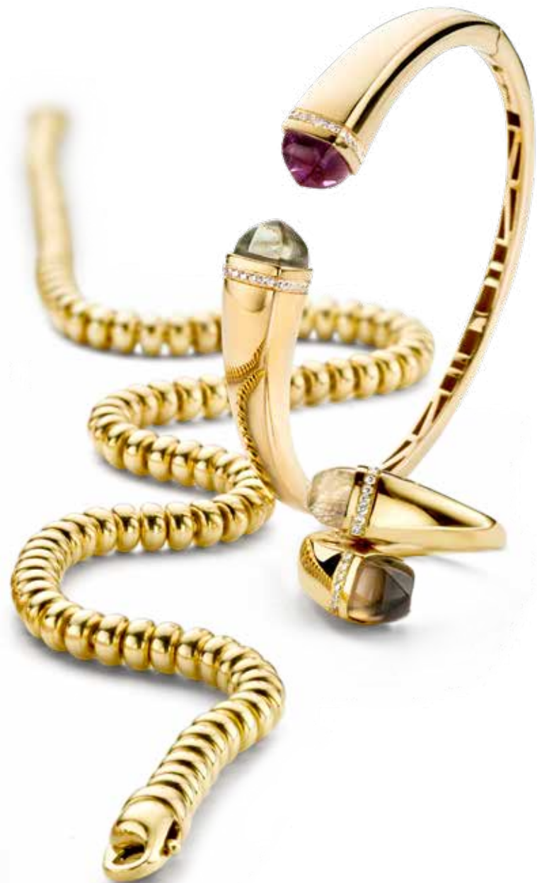
Collier €3.895,- Armband €2.895,- Ring €1.725,-

Gouden sieraden van Saffier Juweliers met natuurlijke rondingen en fraaie details zoals het subtiel gebruik van warme kleuredelstenen. Een juweel als een verleidelijk omhelzing.