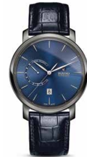
Diamaster Power Reserve 43 mm € 2.260,-

Centrix in een zeer delicate 23 mm kast die echter heel ongenaakbaar is.