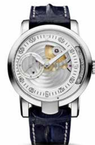
Manual Water € 9.950,-

Behalve dat Armin Stroms eerste meesterwerk zeer gecompliceerd is, is het ook zeer praktisch. De twee tijdzones staan zij aan zij in de opvallend ovale titanium kast en dat zorgt voor optimale afleesbaarheid. Ook functioneel zijn de twee gangreserve-indicaties en de geguillocheerde wijzerplaten en de 24-uurs indicatie op 6 uur. De zeer exclusieve Masterpiece 1 Dual Time Resonance bevestigt de keuze van Saffier Juweliers nog maar eens voor het opnemen van Armin Strom in de collectie. Het jonge merk blijft namelijk steeds maar weer verbazen en verrassen met bijzondere horlogecreaties. De Dual Time Resonance van Armin Strom is dubbel en dwars een waar meesterwerk. Twee volledig onafhankelijke dubbele tijdsaanduidingen die door twee onafhankelijke uurwerken resonantie creëert, een uurwerktechniek die het horlogehuis Armin Strom uniek en opvallend maakt. De tot slechts 8 stuks gelimiteerde Dual Time Resonance benadrukt de gedrevenheid plus de buitengewone technische en artistieke capaciteiten van Armin Storm.