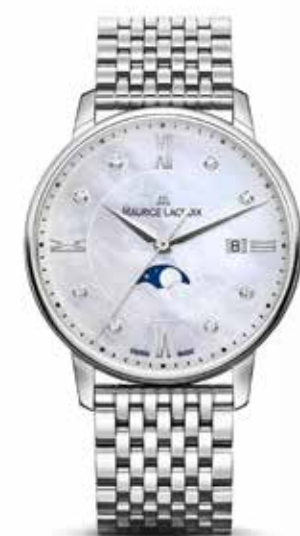
Eliros Moonphase 35 € 1.095,-

Aikon Chronograph Automatic uitgevoerd in gesatineerd staal met gepolijste accenten. De Aikon is een toonbeeld van kracht en karakter door de uitgesproken vormen, het klassieke Clous de Paris-patroon op de wijzerplaat en het automatische chronograafuurwerk in de 44 mm kast.