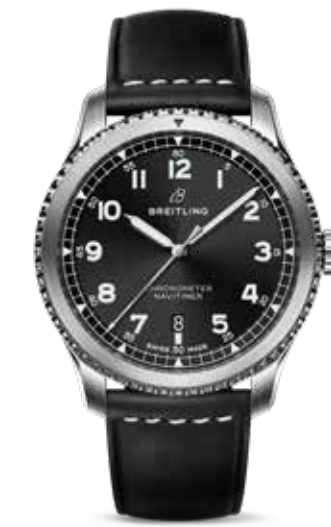
Navitimer 8 Date 41 € 3.600,-