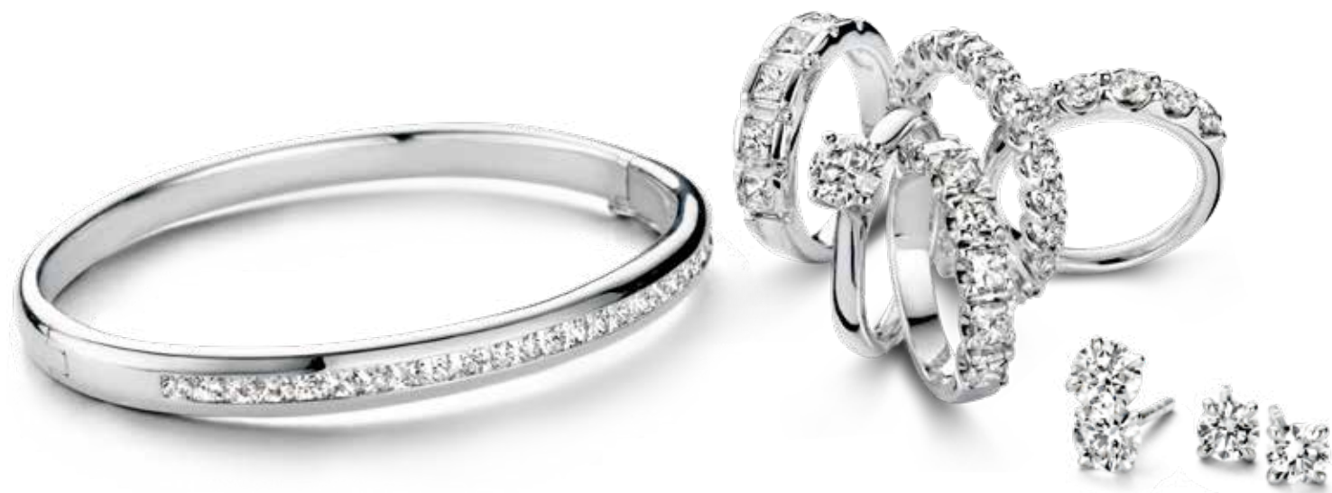
Hanger links €9.950,- rechts €13.500,- Armband €9.850,- Ringen €4.350,- €18.500,- €8.750,- €8.450,- €3.750,- Oorstekers €9.650,- €4.750,-

Een diamant staat voor eindeloze schoonheid en vertelt altijd een verhaal. Een vrolijk en hoogstpersoonlijk verhaal van een huwelijk, een verloving of een verjaardag bijvoorbeeld. Witgouden sieraden met diamant maken elke gebeurtenis onvergetelijk.