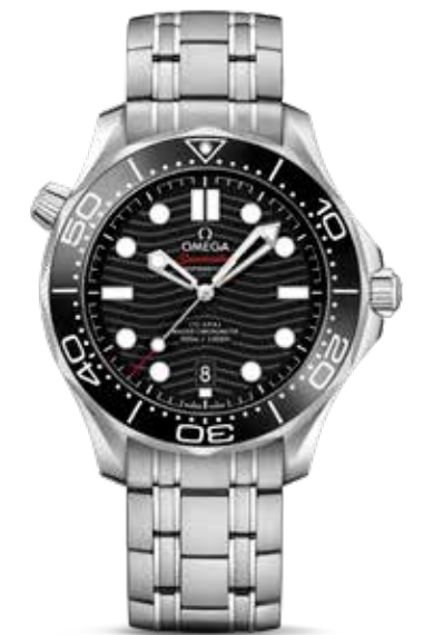
Seamaster Diver 300m € 4.500,-