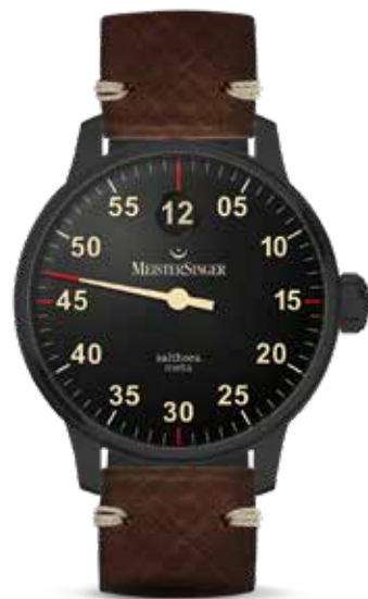
No 3 Black Line (Carbon) € 1.790,-

NL Edition 2018 - Limited Edition in bronzen 43 mm kast. Saffier heeft nummer 007 van de 118 exemplaren die speciaal voor Nederland zijn gebouwd. In de kast die door het verstrijken van de tijd een prachtig en uniek patina ontwikkelt, tikt het automatische kaliber ETA 2824-2 dat door een zichtbodem is te bewonderen.